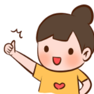
本案依黎明技術學院完善就學協助機制補助辦法實施