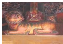
孔廟－大城殿三川門