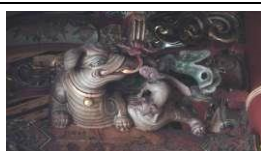
表 5 象座形態斗座圖像

大象，是陸地上體型最大，力量最大的動物，與「祥」字諧音，便有吉祥萬象和納福的寓意。當國勢昌隆時才會有南方使節進貢大象，借此祈求國家長治久安、物富民豐，太平有象的意思（康錫諾，2007）。