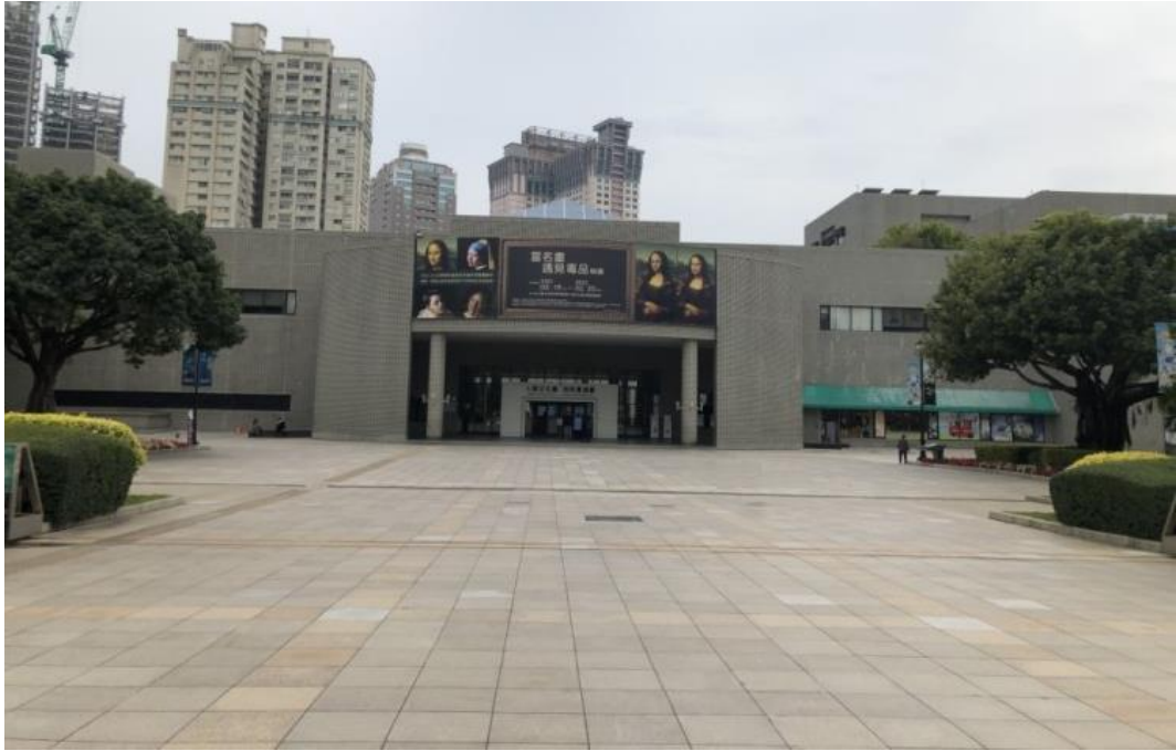
人類文化廳前廣場