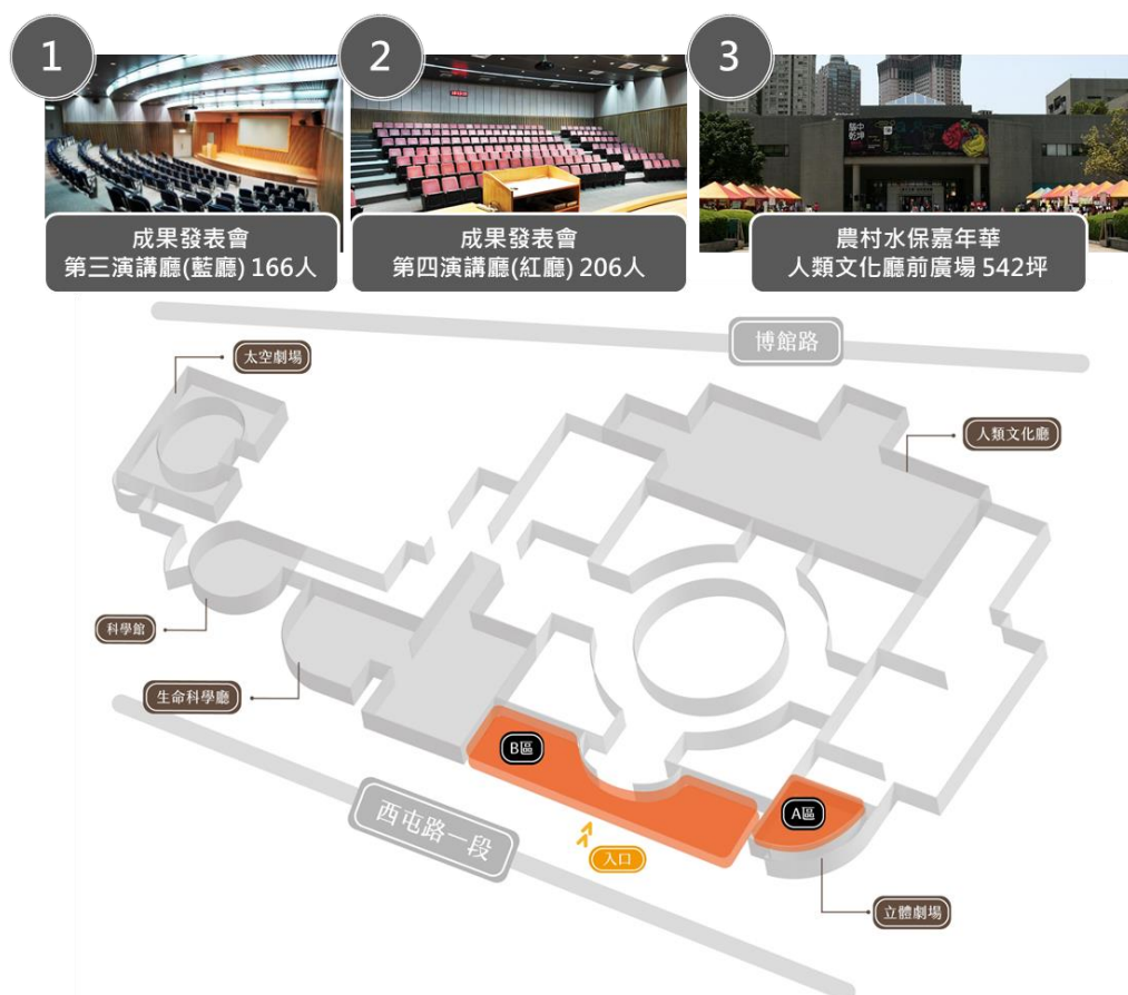
嘉年華展區位置圖