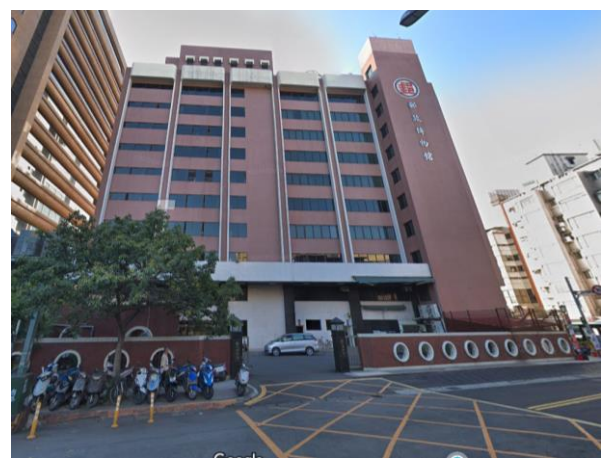
位於牯嶺街上的貨車卸貨區(郵政博物館後門)