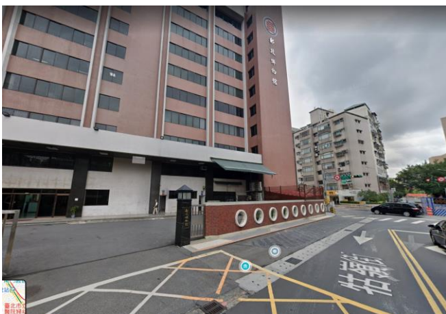
位於牯嶺街上的貨車卸貨區(郵政博物館後門)