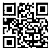
公民評鑑網站 QR Code