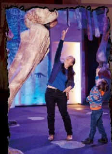
親眼見證泰坦恐龍的震撼