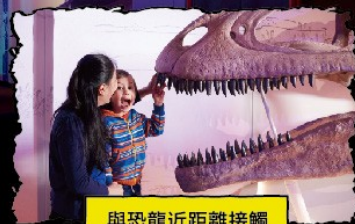
與恐龍近距離接觸