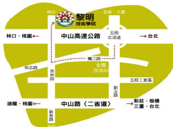
黎明技術學院交通位置圖

本校相關交通路線請參考本校網頁 https://www.lit.edu.tw/traffic-info/